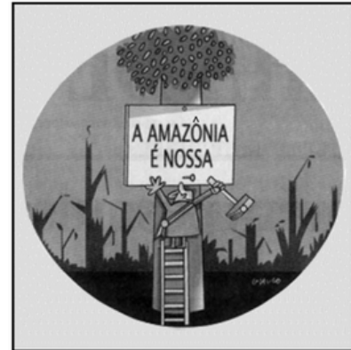
Glauco. Folha de S. Paulo, 30/05/08.

29. A crítica presente na charge de Glauco, publicada na Folha de S. Paulo, decorre do contraste entre a frase "A Amazônia é nossa" e: